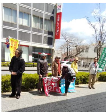
3000 万人署名に署名する市民