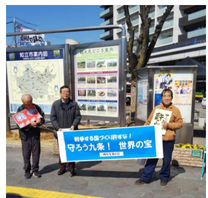
西尾市九条の会の横断幕